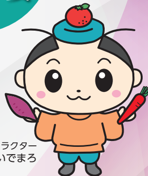
坂出市公認キャラクター さかいでまる